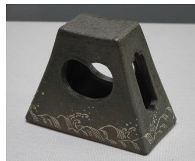
八代焼波文象嵌陶枕