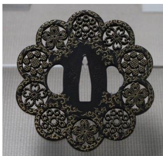
肥後鐺(桜九曜紋透鐺)

熊本藩の御用窯で雅味あふれる茶道具を生産した八代焼(高田焼)、コレクターに人気の高い肥後鐺や八代染韋、熊本のヒーロー加藤清正の実像を紹介する古文書、球磨川周辺に残るめずらしい風習「七夕綱」、弥生時代の出土品など、6名の学芸員による最新の調査研究の成果を展示し、八代の歴史と文化に対する理解を深めていただいています。