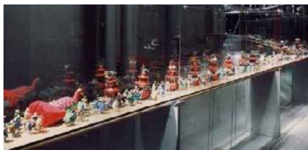
八代妙見祭の神幸行事 人形模型