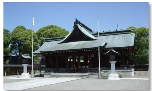
八代城本丸に建つ八代宮社殿

明治13年（1880）八代城本丸跡に創建された八代宮は、南北朝時代に征西将軍として活躍した懐良親王（後醍醐天皇の皇子、八代に御墓がある）をまつています。