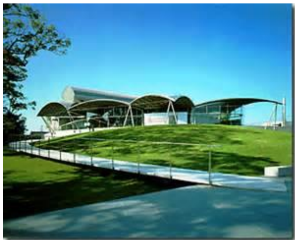
八代市立博物館未来の森ミュージアム 外観

近未来的な外観を持つ建物は、建築家伊東豊雄氏の設計によるもので、今や日本を代表する建築家として活躍されています。