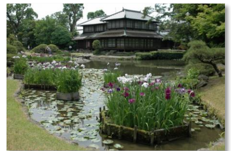
肥後花菖蒲の時期の松浜軒

当時は海浜も近く、「松浜軒」の名はこれに由来しています。庭内にある池は、もともこの地にあった赤女が池を取り込んだもので、池の中央には玉石を置いて海浜を表した中島や、深い山奥の趣を見せる築山などがあり、二階建の主屋にある書院からの眺めに考慮した配置